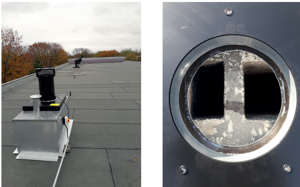
Abbildung 2: Abbildung des DVND 315 montiert auf Aluminium-Dachsockel (links) und Blick in den Lüftungsschacht (rechts)

*Die Maße des Aluminium-Dachsockels können individuell an den Schacht angepasst werden (Fertigbarkeit der Maße auf Anfrage; Fertigbarkeit für rechteckige Schächte mit Außenmaßen 350 ... 850 mm Breite und 350 ... 2.000 mm Länge sind standardmäßig herstellbar).